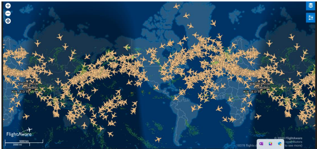
Aerei in viaggio: immagine estratta da aerei nel mondo: https://www.flightaware.com/live/map

Si tratta di immagini incomplete perché mancano i voli per esigenze militari e i conseguenti bombardamenti e mitragliamenti che ci sono ogni giorno nel mondo. È utile ricordare cosa scaricarono gli aerei della NATO quando bombardarono la SERBIA distruggendo centrali elettriche, industrie e abitazioni civili, oltre ai proiettili all'uranio impoverito che hanno invalidato e ucciso anche i nostri soldati inviati in quelle zone senza che fossero informati e dotati delle opportune protezioni. Soldati costretti a pagare contenziosi per far riconoscere il diritto al risarcimento e che hanno dovuto aspettare anni, prima di leggere le sentenze e percepire i relativi riconoscimenti e risarcimenti.